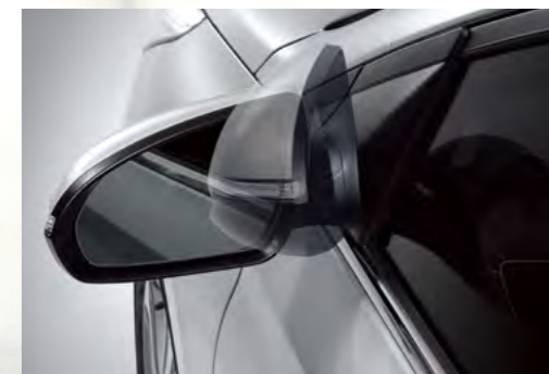
Gương chiếu hậu gập chỉnh điện