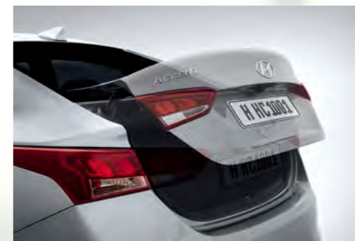
Cốp mở thông minh khi chìa khóa đến gần