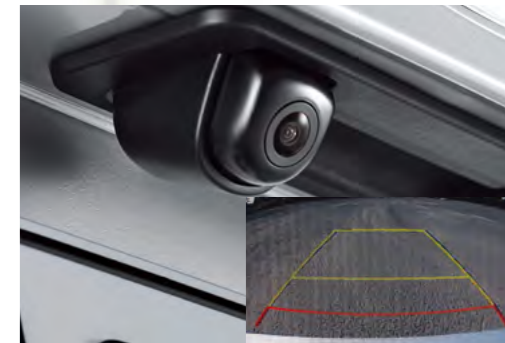
Camera lùi, kết hợp với cảm biến sau xe