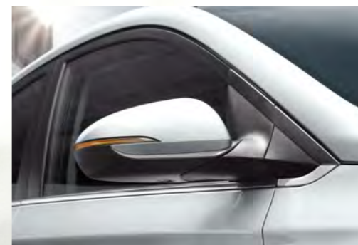
Đèn báo rẽ LED tích hợp trên gương