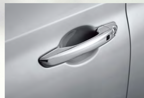
Tay nắm cửa mạ Crom