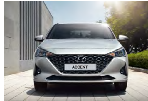
Thiết kế lưới tản nhiệt mạ crom đen kết hợp các khối hình đan xen nhau

Thiết kế mới của Hyundai Accent là một cuộc cách mạng, đem đến vẻ đẹp hấp dẫn của sự kết hợp giữa hiện tại và tương lai. Lưới tản nhiệt bắt mắt với các khối hình đan xen, táo bạo và lớp mạ crom tạo nên sự cao cấp. Đèn định vị LED với hệ thống chiếu sáng projector giúp bạn quan sát rõ hơn vào ban đêm đồng thời mang đến nét tinh tế công nghệ cao.