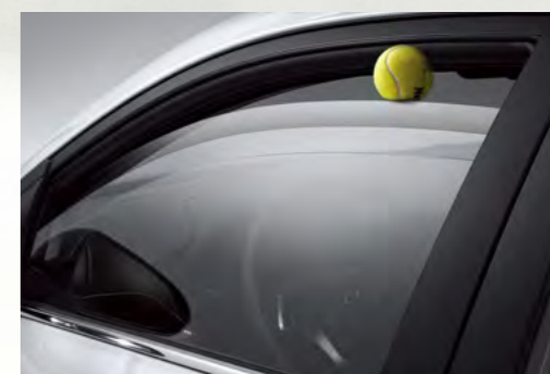
Cửa sổ chỉnh điện chống kẹt