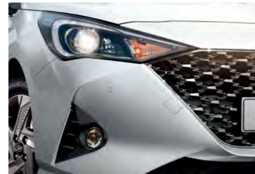
Dải đèn LED ban ngày DRL