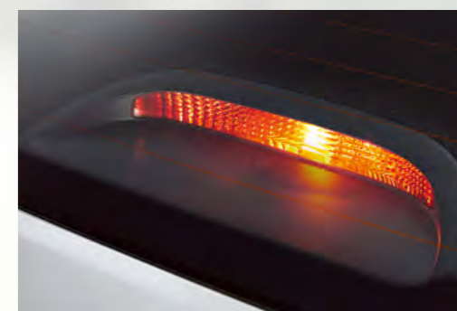
Đèn báo phanh trên cao