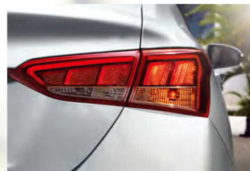
Đèn hậu công nghệ LED 3D