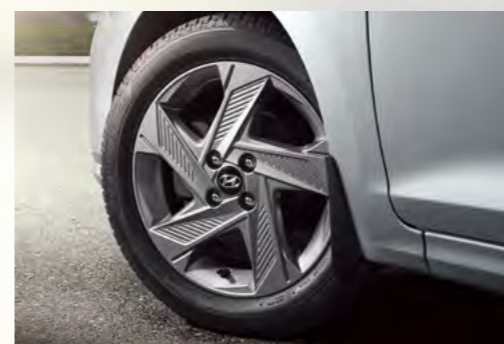
Lazang hợp kim 16 inch (Với phiên bản AT Đặc Biệt)