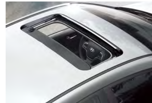
Cửa sổ trời điều khiển điện (Với phiên bản AT Đặc Biệt)